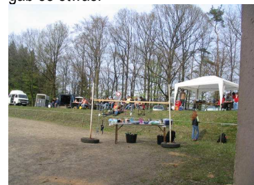
Im Vordergrund der „Gaben-Tisch“

Nachdem alle Teilnehmer wieder eingetroffen waren, konnte schon nach kurzer Zeit mit der Siegerehrung begonnen werden. Die Reiter und die Fahrer wurden getrennt gewertet. Jeder Teilnehmer hat eine Urkunde und eine Tüte Leckerli, die der P&R Reitsportmarkt in Gummersbach zur Verfügung gestellt hat, erhalten. Die Sieger und die Platzierten durften sich vom großen „Gaben-Tisch“ etwas für sich oder ihre Pferde aussuchen. Für jeden gab es etwas.